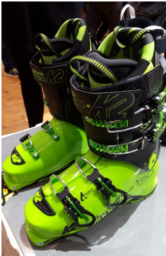
K2 Pinnacle Pro 130