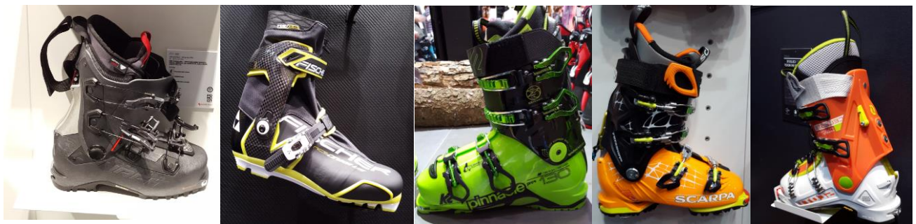
Dynafit – FT1

À l'occasion du Salon International du Sport (Ispo, Munich, 24-27 janvier 2016), les grandes marques de sports d'hiver telles que Dynafit, Fischer, K2, Scarpa ou encore Scott ont présenté leurs derniers modèles de chaussures de ski réalisés avec l'élastomère thermoplastique Pebax®. Ce matériau de performance est reconnu par les professionnels du ski et de la montagne pour sa combinaison unique de légèreté, de flexibilité, de dynamisme et de fiabilité à toutes épreuves. Selon les modèles, il est utilisé pour la coque, le collier ou la semelle des chaussures de ski.